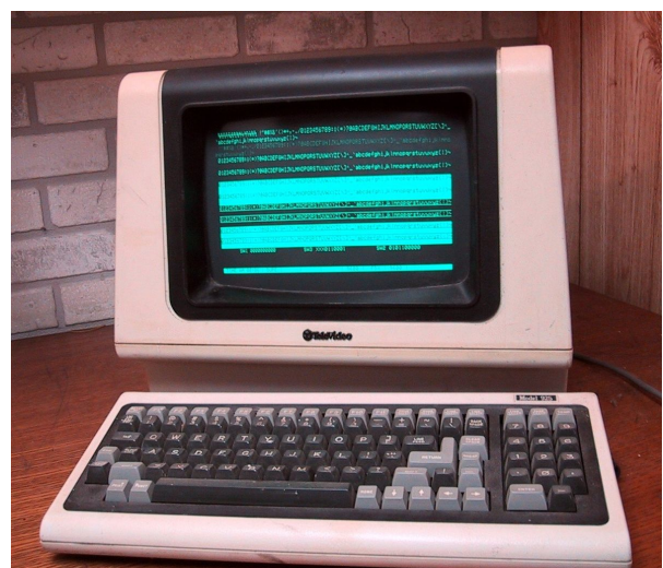
Antes del advenimiento del computador personal, Los terminales de computadora fueron usados para acceso en tiempo compartido de los computadores centrales (mainframes)

Un modelo diferente del uso del computador fue presagiado en la manera en que fueron usados los tempranos computadores experimentales precomerciales, donde un usuario tenía uso exclusivo de un procesador. [1] En lugares como el MIT, los estudiantes con acceso a algunos de los primeros computadores experimentaron con aplicaciones